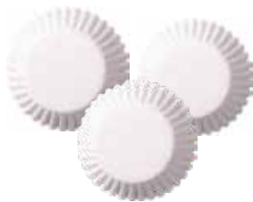
1, 2, 3, 4