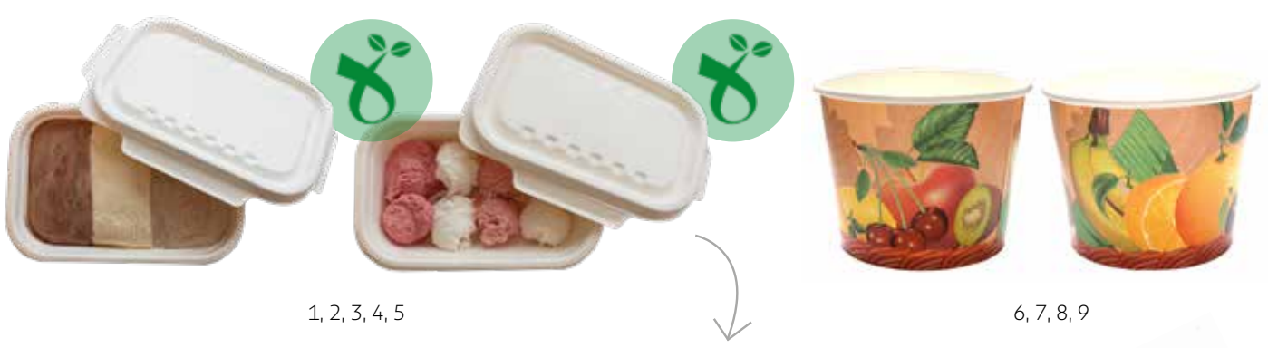
1, 2, 3, 4, 5