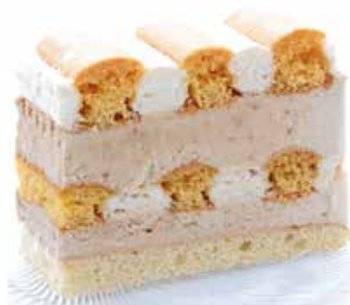
606240 TK Kardinalschnitte 7 Stk.