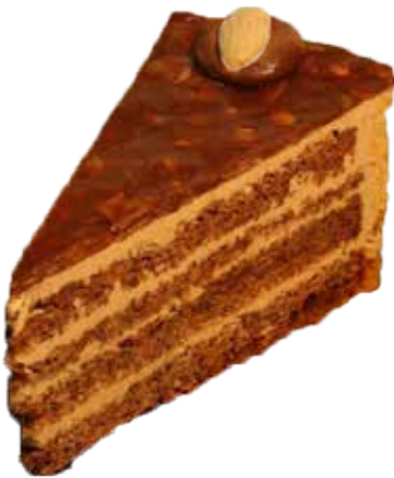
606785 TK Nusstorte 10 Stk.