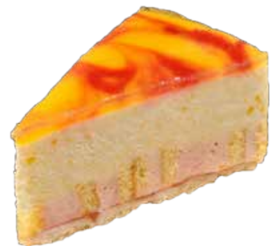
606247 TK Pfirsich Joghurt Torte 10 Stk.