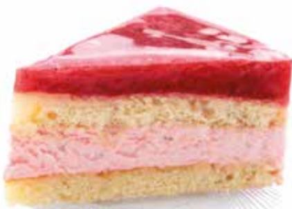
606239 TK Erdbeer Torte 8 Stk.