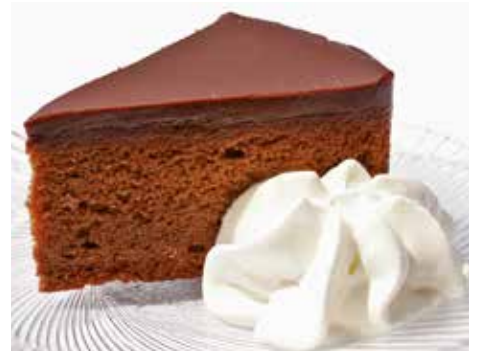
606242 TK Sachertorte 8 Stk.