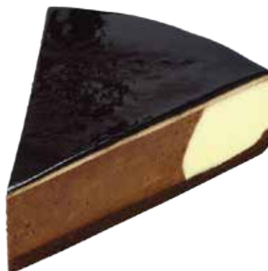
606589 TK Mousse au Chocolate Torte 8 Stk.