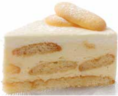
606243 TK Malakofftorte 8 Stk.