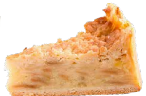
606767 TK Apfel Dinkel Birkenzuckertorte 8 Stk.