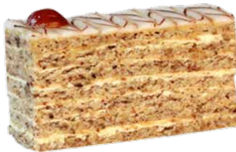
606575 TK Esterhazyschnitte 9 Stk.