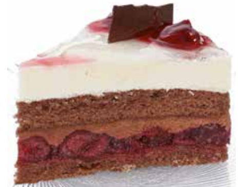
606241 TK Schwarzwälder Kirsch Torte 8 Stk.