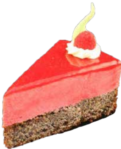
606246 TK Himbeer Mohntorte 10 Stk.