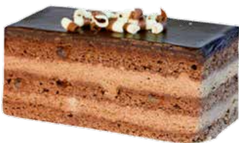
606574 TK Schokoschnitte 7 Stk.